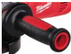
AGV 17-180 XC/DMS