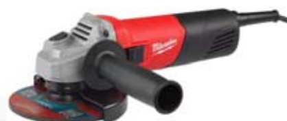
AG 800-115 E