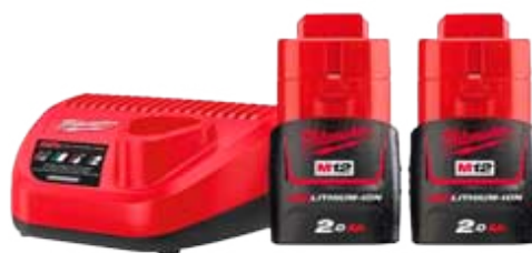
Pack M12NRG-201 Cargador + 2 Baterías 12V 2.0 Ah